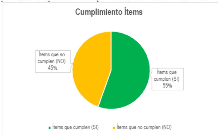
Gráfica 1 Cumplimiento de los requisitos mínimos de publicación de la información – Alcaldía Local Rafael Uribe Uribe

Respecto a los 229 criterios aplicables a la Alcaldía Local, se evidencia que el 55% (127 criterios) cumple, mientras que el 45% restante (102 criterios) no cumplen. Los resultados obtenidos permiten evidenciar la necesidad de fortalecer los mecanismos institucionales de seguimiento y control sobre el cumplimiento de la Ley 1712 de 2014 y de los lineamientos asociados al ITA, promoviendo acciones orientadas a garantizar la actualización, completitud, accesibilidad y sostenibilidad de la información publicada para consulta ciudadana.