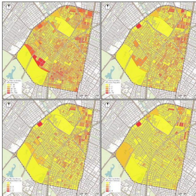
Mapa 2: matrículas activas y vigentes por tamaño por ingresos por manzana en la localidad