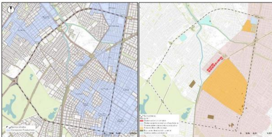
Mapa 4: corazones productivos y ESECI en la localidad