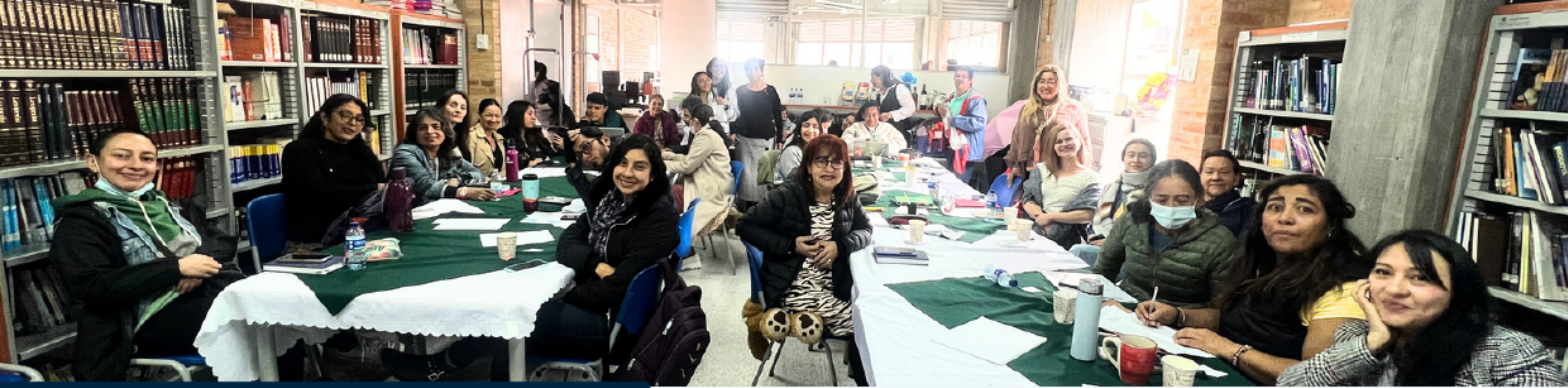
Colegio Camilo Torres - Bogotá- Sensibilización a docentes. 2025