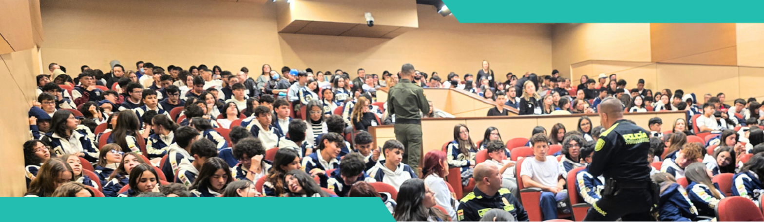
Colegio Americano de Bogotá 2025