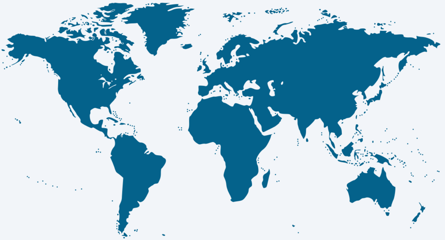
Ilustración 3: Normatividad Internacional sobre libertad religiosa, culto y conciencia