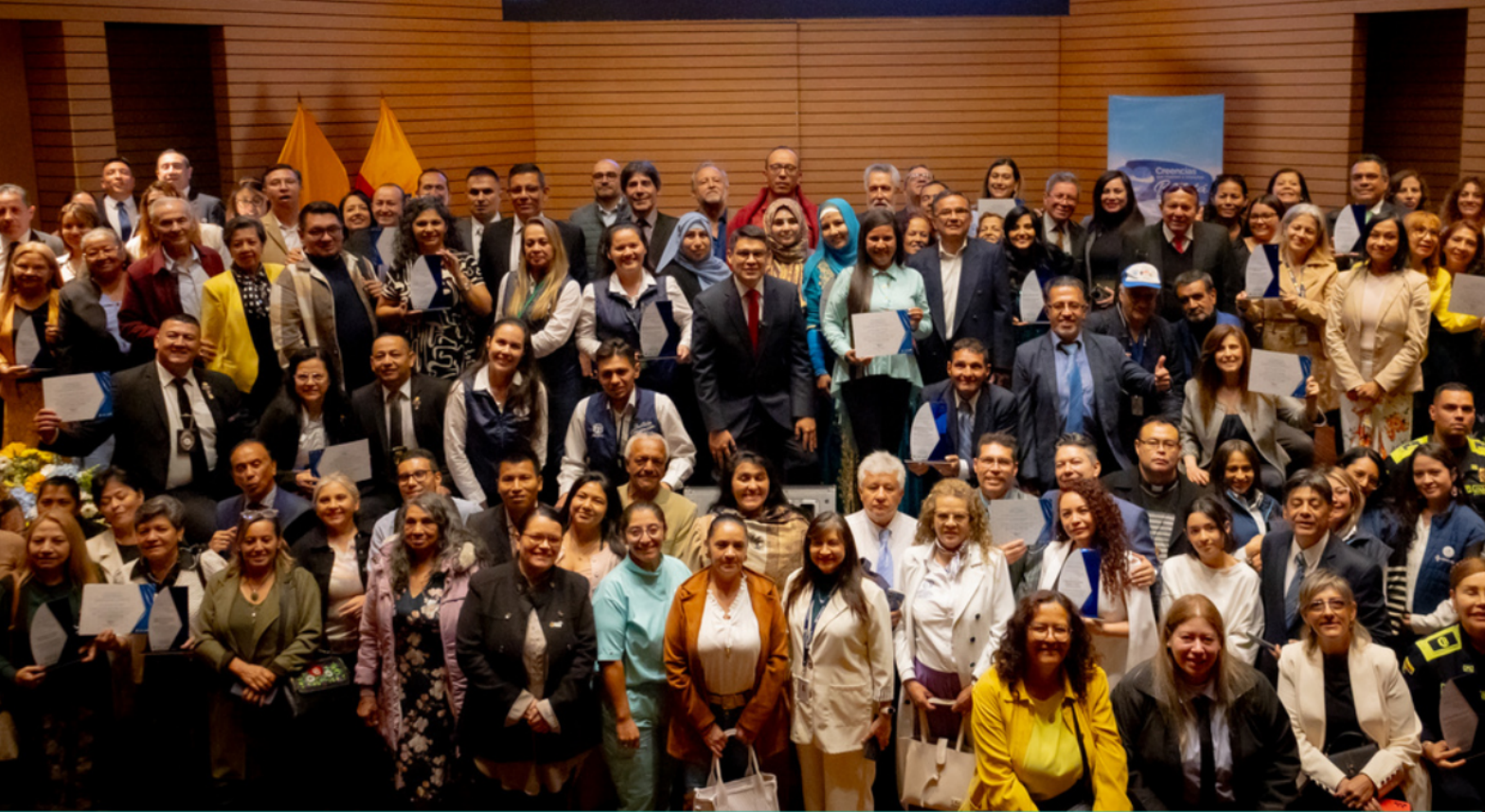
Gala: Creencias que Inspiran e Impactan Bogotá - 2025