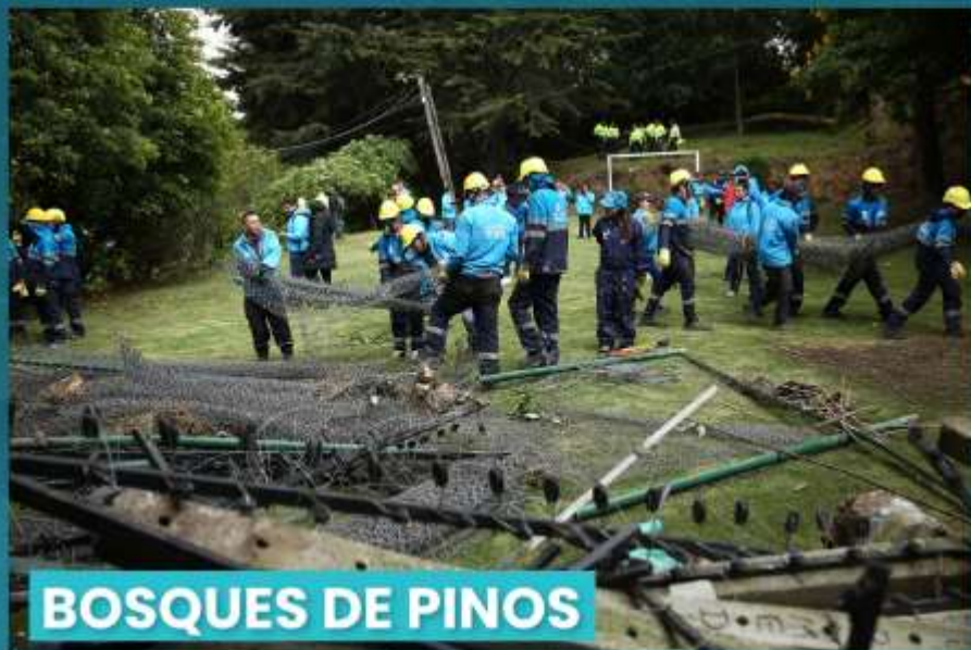
BOSQUES DE PINOS